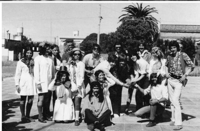
En Viedma con sus compañeros. Egresados y festejo del egreso

En 1972 se radicó en la ciudad de La Plata y comenzó sus estudios universitarios en la carrera de Abogacía. Rápidamente se integró a la vida estudiantil.